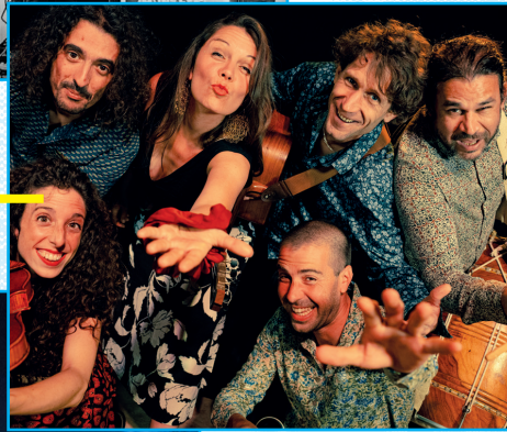
17/07 FLM (FIRST LOVE MAMA) REPRISES POP ROCK