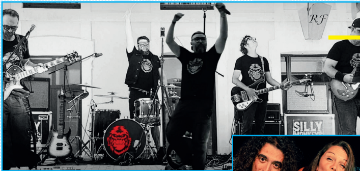
03/07 SILLY MONKEYS ROCK ALTERNATIF