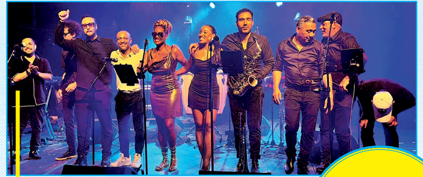
07/08 CUBA DO RÉ MUSIQUE LATINA